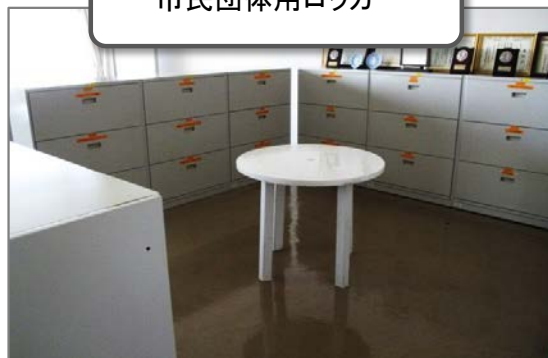
市民団体用ロッカー