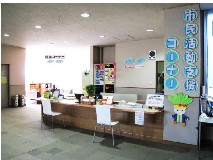
【市民活動支援コーナー受付】

市民の皆さまの、生涯学習や市民活動及びボランティア活動を推進し、活動的で豊かなまちづくりのお手伝いをしています。