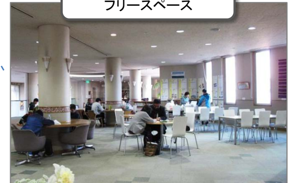
市民活動支援コーナー フリースペース

市民活動・ボランティア活動などの、団体の運営上の悩みや疑問、事業の企画の相談、助成金の紹介や生涯学習の相談などについて、市民活動コーディネーターが応えます。