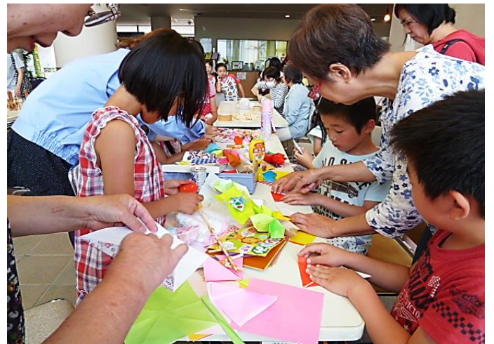
■楽習館で行われる“ヤッキーひろば”参加■ 子どもたちと一緒に折り紙あそびを楽しみました。

なかよし会は、平成23年11月に八潮市社会福祉協議会で実施された『子育て支援ボランティア講座』の受講者有志で結成したボランティア団体です。会としての初めての活動は翌年2月、八幡公民館で行われた家庭教育学級『すぐできるひな祭り料理』での託児ボランティアでした。