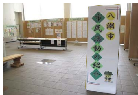
八潮市の市民活動のパネル展示を行いました。八潮市コミュニティ協議会や市内のNPO法人、市民活動団体や市民活動支援コーナーの事業などを紹介しました。