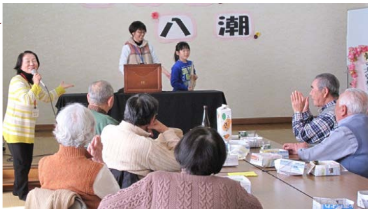
●すえひろ荘での活動の様子 かわいい小学生のボランティアさんも一緒に活動しました。