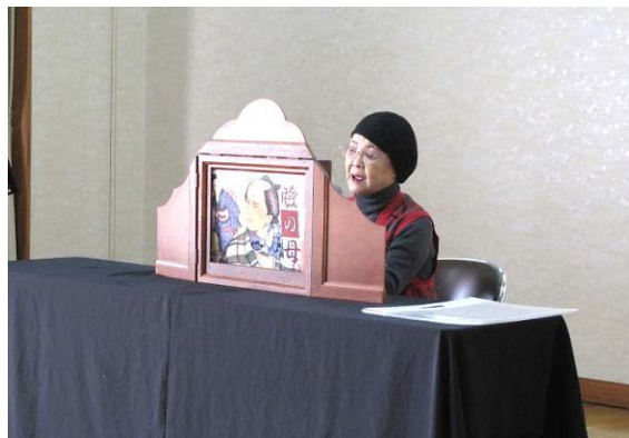
● 今回の演目は『瞼の母』です。

高齢の方には「金色夜叉」や「瞼の母」など、若かったころに聞いた物語の紙芝居を上演し、一緒に懐かしい歌を歌ったり、手遊びなども交え、喜んでいただけるような内容にしています。「楽しかったよ。」「また来てね。」などと声をかけられると、やってよかったと嬉しい気持ちになります。